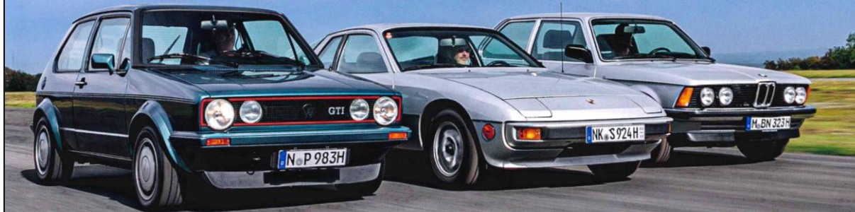
VW Golf I GTI, Porsche 924 und BMW 323i