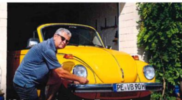
US-Import braucht Zuwendung Restaurierung Käfer Cabrio