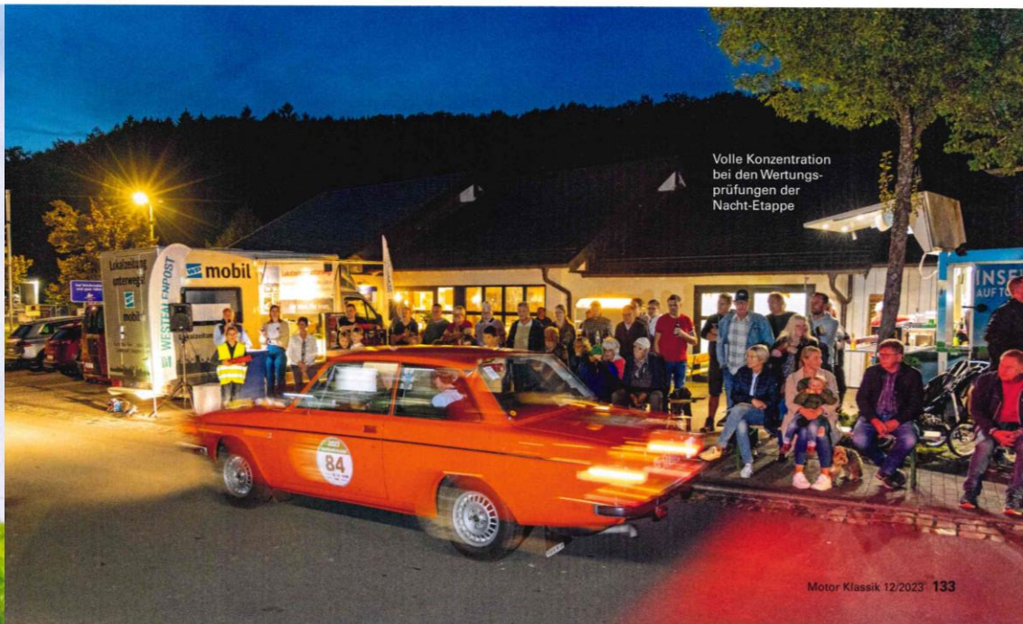
Volle Konzentration bei den Wertungsprüfungen der Nacht-Etappe