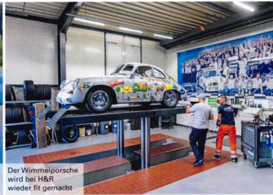
Der Wimmelporsche wird bei H&R wieder fit gemacht