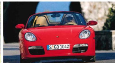
Der zweite Boxster ist jetzt günstig Kauf-Check Porsche 987