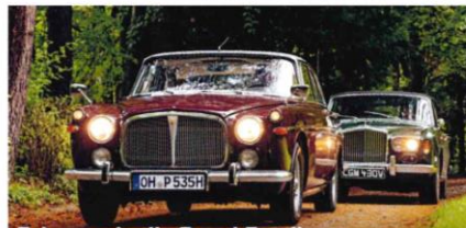
Fahren wie die Royal Family Rover P5B Coupé & Bentley T